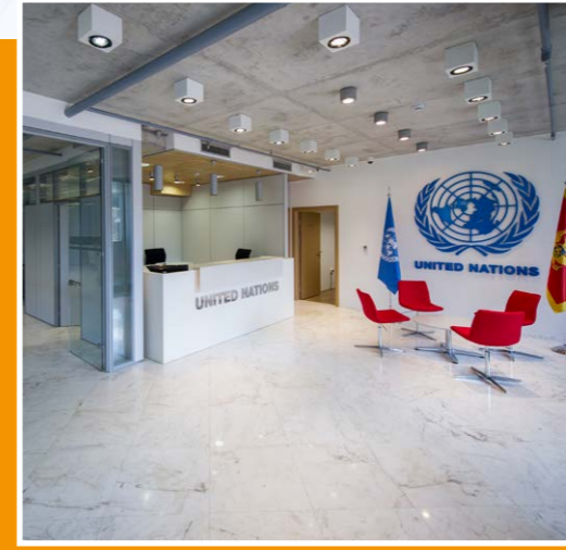
UN Eco Building in Podgorica, Montenegro