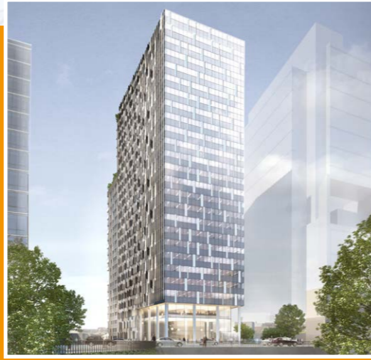
The One in Brüssel, Belgien