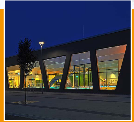
Lippe Bad in Lünen, Deutschland